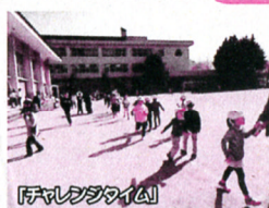
「フェリススタジアム」