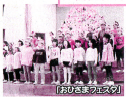
「おひさまフェスタ」