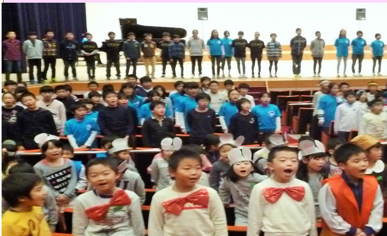
6年生が各学年の歌の指導をして、一つにつくりあげた 全校合唱「ひまわりの約束」

一人一人が主人公！ 感動につなげる表現力！ おひさまフェスタ 2015 11/14 山形市民会館大ホール