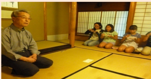
お茶クラブをご指導して下さる先生と