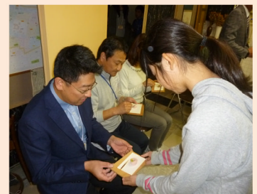
校長室に来てくださった保護者の方にお点前披露