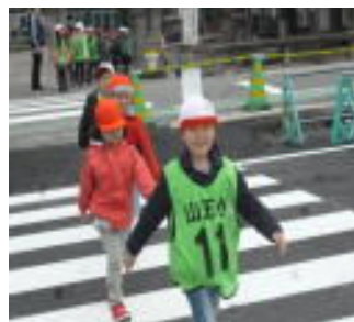
安全確認して横断歩行