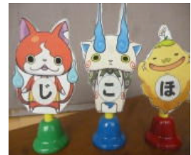
3つの約束☑ ☑ ☑