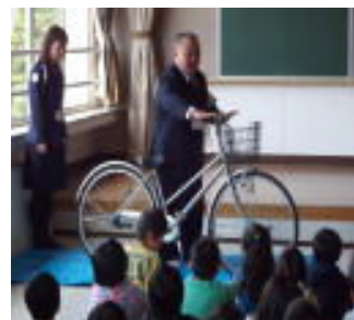
自分に合った自転車で