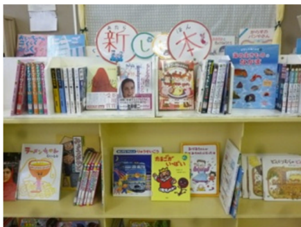
図書室に入ったたくさんの新刊本