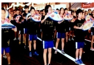
花笠パレード親子で出場(6年生)

(※5GOサポート隊：子ども達の生活や活動へのボランティア支援をして下さるPTA会員)