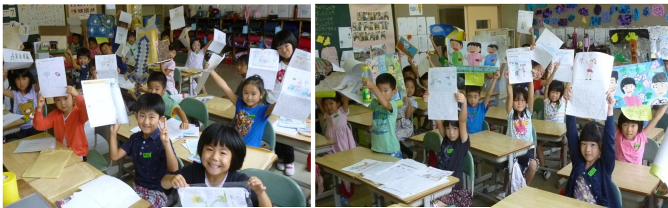
夏休みにつくった作品を掲げる1年生

26日間ぶりに顔を合わせた2学期始業式、随分日に焼けた顔も目立ちとてもたくましさを感じました。この夏休み、子ども達は自由研究をはじめ絵画・工作・絵日記・作文などの選択活動で得意分野を生かしたり、地域行事の夏祭りやラジオ体操会に進んで参加したりするなど地域の仲間とのかかわりを大事にしていました。また、6年生は親子で花笠パレードに出場し、県の花笠協議会舞踊指導員の会長さんから「きれいな踊りで揃っていた。」とお褒めの言葉をいただくほど、一体となった踊りを披露することができました。ひとえに、6学年P委員長を中心とする保護者の皆さんと山形大学の花笠サークル「四面楚歌」の絶大なる支援のおかげと感謝しております。