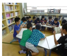
畳敷きのスペースでお気に入りの本を読み合う