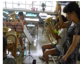
吹奏楽部パート練習

2学期のめあてとして、上学年代表の児童より①温かい友達関係 ②友達や先生の話をよく聞く ③バスケットボールで県大会出場 ④マラソン大会で連続一位を目指す。下学年代表の児童より①リコーダー演奏 ②道徳を学び、人の心や気持ち大切に ③体育の表現運動を頑張る とそれぞれの決意の発表がありました。2学期の授業日は80日間ありますが、スポーツの秋、芸術の秋、食欲の秋、読書の秋と一年中で一番過ごしやすい季節でもあります。こういった夏休みの成果をステップにし更なる挑戦を期待しています。