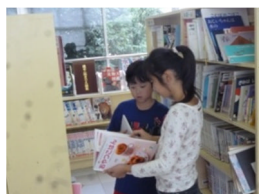
「この本面白いよ」と友達に伝えて