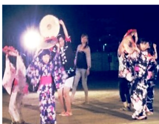
五地区夏祭りに浴衣で参加