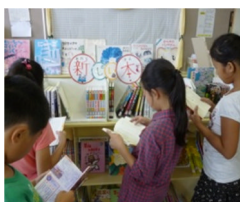
新刊本を楽しみにして