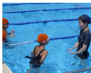
水泳教室で泳ぎのこつを学ぶ