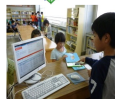
本の貸出や返金は図書委員がパソコンで