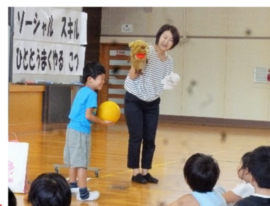
SSTについて全校児童へ説明

本校では、相手を尊重する話し方やトラブルになった時の対処法など、 温かい人間関係を構築するための具体的な関わり方 について、SST（ソーシャルスキルトレーニング）の学習をしています。