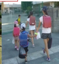
登校する下学年の面倒を見る上級生