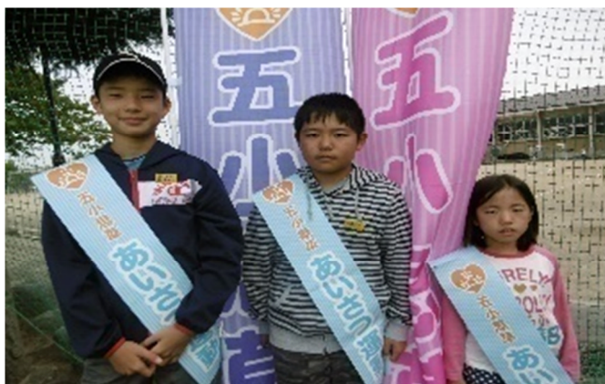
ジュニアプロ委員とあいさつりレー者として指名された子ども達