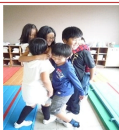
「なかよし集会」の班活動で