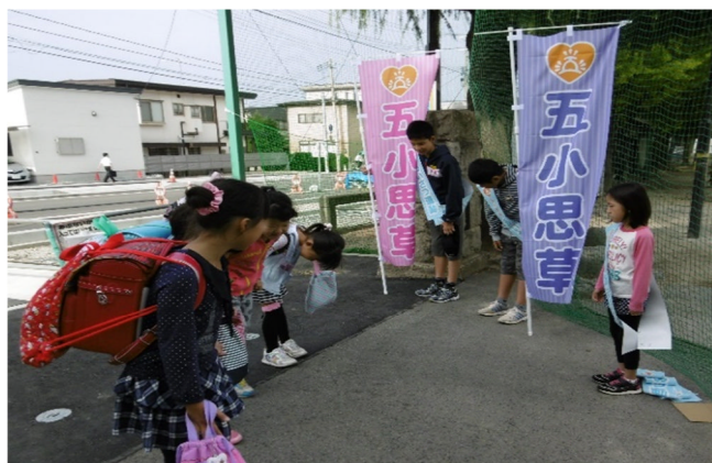
「五小思草」ののぼりやたすきを目にすると自然に丁寧な挨拶に

児童会による新たな「あいさつ運動」として、「五小思草あいさつりレー」が始まりました。さわやかな挨拶の声が全校に響き渡るようにと、毎朝、校門前に児童会のジュニアプロジェクト委員の他、指名された5名の子ども達が、五小思草のたすきをかけはりきって挨拶運動をしています。登校時間が終わると5名の子ども達は、学年に関係なく次の人を指名しあいさつりレーが続いていきます。