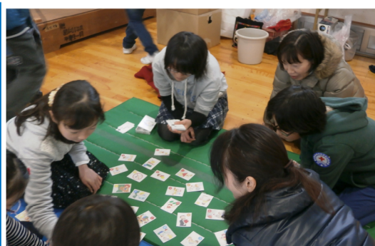
「防災カルタ」で防災意識の啓発を図る

地区のJRC団体との連携として、児童会ジュニプロ5・6年生のメンバーが、炊き出しや防災カルタ、ペットボトルを使ったボーリングなど、いざという時に役立つ避難所支援の体験活動のお手伝いをしました。