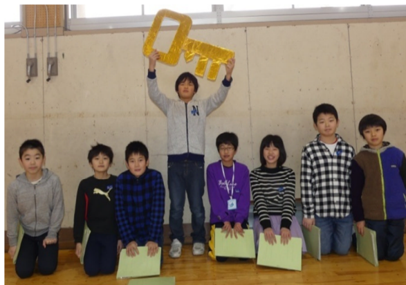
五小児童会伝統の『黄金の鍵』を掲げて！