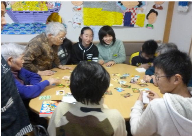
お婆さんとの間に入ってカルタを楽しむ6年生