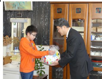
エコキャップ贈呈式

みんなの協力で集まった ペットボトルキャップ 98.4kg —「エコキャップ推進運動」環境委員会—