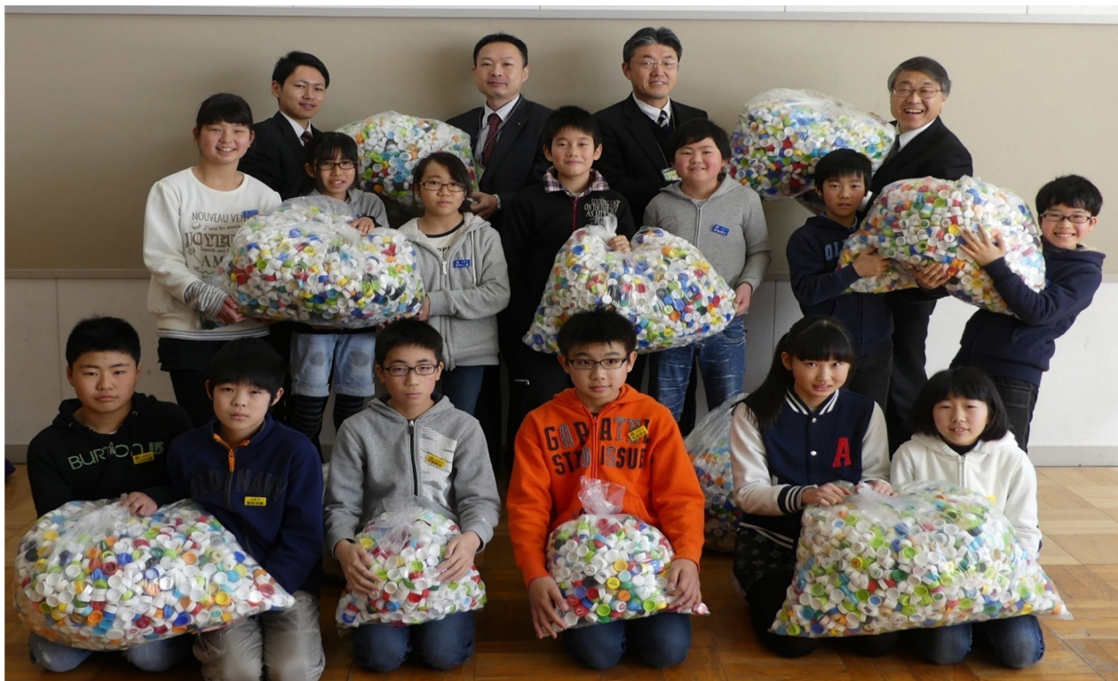
ペットボトルのキャップを抱える児童会環境委員と山形銀行の方々

2月18日 山形銀行東原支店長さんをお迎えして贈呈式を行いました。プラスチックの現在の相場価格によりますと6.7kgで一人分のポリオワクチン(20円分)が購入できるということでしたので、 約14人分の子ども達の命を救う ことができたということになるようです。村山特別支援学校山形校の皆さんにも協力をいただきました。また、わざわざ学校に届けてくださったたくさんの保護者や地区の方々に感謝申し上げます。