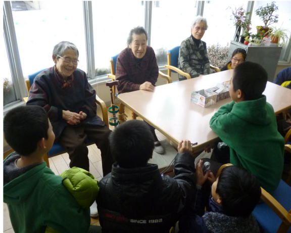
にこにこして僕たちの話を聞いてくれたよ

第五地区のお年寄りの方との交流として、6年児童50名が、共同生活介護事業所「フラワー小姓町」を訪ねました。施設に入った6年生は、最初緊張してどのように関わっていいか迷っていましたが、カルタや肩もみなどをして交流していくうちに、自分の家のお爺ちゃんやお婆ちゃんかのように、自然にお話をして交流することができました。お婆さんの中には、五小出身の方もおられ、昔の五小のことや歌を教えてくださいました。6年生にとって、今回の訪問では「初めて会った方への関わり方について」とても勉強になったそうです。機会があればまた訪問してみたいと子ども達は言っていました。「フラワー小姓町」の職員・入所者の皆様方に深く感謝申し上げます。