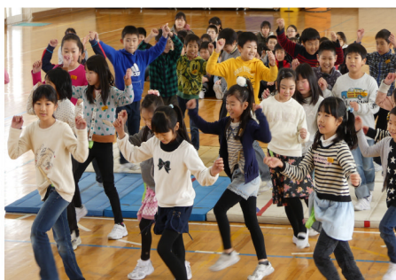
3年生身体表現「パーフェクトフェム」