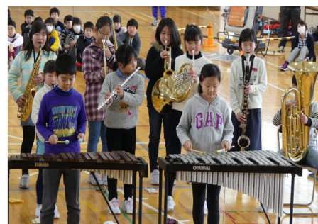
4年生合奏「茶色の小びん」