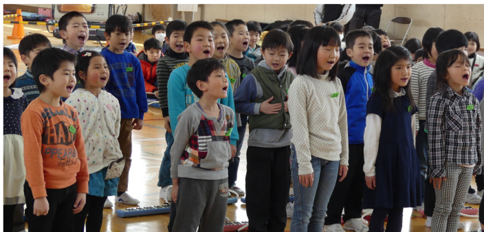
1年生合唱奏「小犬のマーチ」