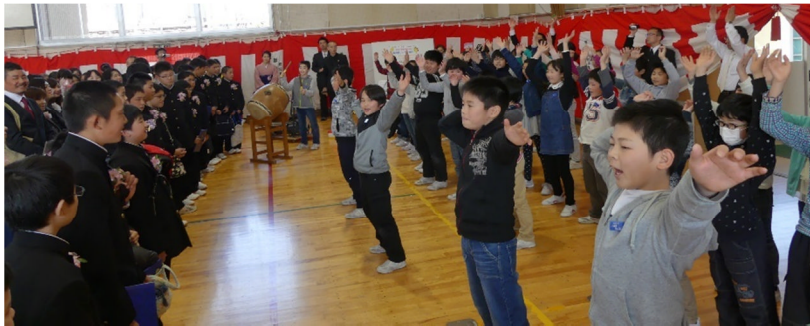
5年生による激励のエール