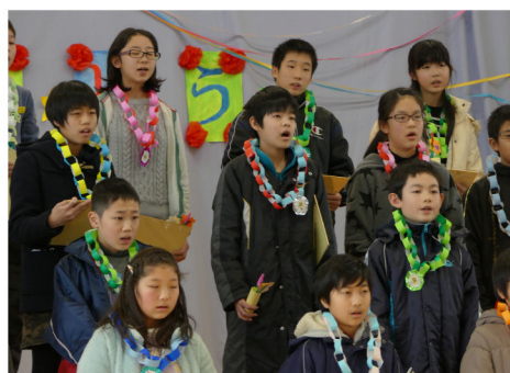
6年生合唱「ありがとう」