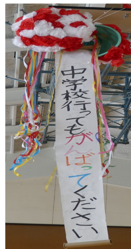
実行委員制作によるくす玉

「6年生を送る会」では、児童会の実行委員を中心として、〇×クイズや人数つくりゲームなどで楽しみ、また、6年生への感謝の意を表そうと、手づくりの首飾りやメッセージ色紙をプレゼントしたり、学年ごとによるパフォーマンス表現をしたりしました。6年生がじっくりとメッセージを読んでいる姿に感動しながら、6年生と過ごした思い出をふりかえりました。