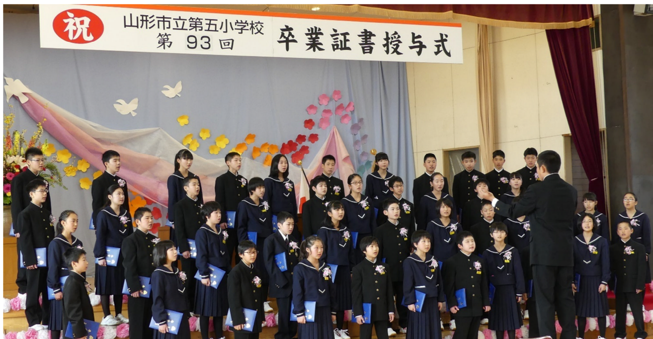
卒業証書を抱え、体育館に響き渡った卒業生合唱「旅立ちの日」♪