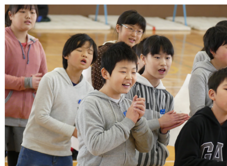
5年生合唱「世界に一つだけの花」