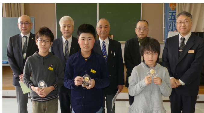
6年間の「皆勤賞」を受賞した子ども達 (同窓会入会式で)