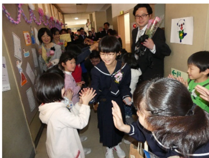
後輩にハイタッチをする門出の風景

卒業生50名の6年間で伸びた身長平均の長さは、35.8cm ありました。この身長の伸びと同じように、 卒業生の心も大きく成長 していたようです。卒業を前に書いた作文「6年間で成長したこと」では、「失敗してもあきらめないで頑張ったこと」や「勇気を出して自分から挑戦すること」など、 成長の足跡がたくさん綴られていました 。特に、1年生が喜んでくれるようにと、何度も手直しをして創りあげた「手づくり絵本」の読み聞かせ、「フラワー小姓町」の福祉施設を訪れ、お年寄りの方とのカルタ交流、そして「五小思草」挨拶リレーの模範となって取り組んだ活動など、 温かいかわりを大事にしてきました。その経験を中学校でも生かして いってください。