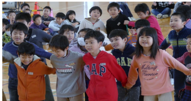
2年生斉唱「負けないで」&リズム縄跳び