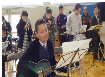
先生方全員による合奏「ハピネス」