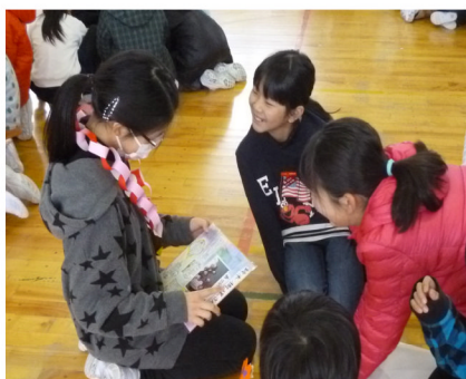
色紙のメッセージを読む6年生