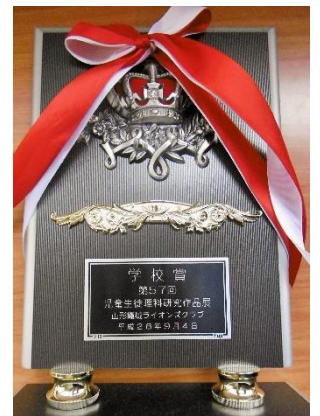
名誉ある学校賞の盾

受賞者代表として表彰式に参加した6年児童は、毎年この作品展を楽しみにしており、金賞を受賞した