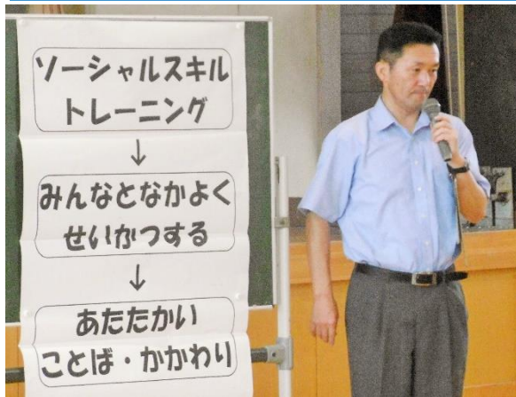
「SST」について全校児童に説明

なった時の対処法など、温かい人間関係を構築するための関わり方について、具体的な場面や状況を想定して行動につなげるSST（ソーシャルスキルトレーニング）の学習をしています。