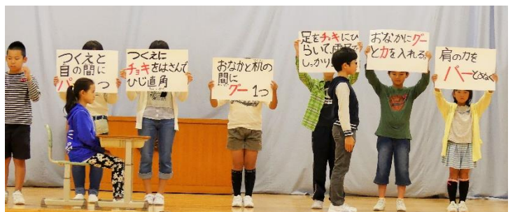
「よいしせい」になるための方法を健康委員会が提案

目を悪くしないように自分の姿勢を考えようと、児童会の健康委員会から具体的なよい姿勢についての提案がありました。「よいしせいづくり」週間を設け、全校で集中して取り組んでいます。