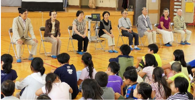
先輩方をお迎えし、昔の五小の様子をお聞きました

私たちの大先輩（昭和30年度卒業生）が60年ぶりに本校を訪れ、私たちと一緒に校歌をうたったり昔の五小の様子をお聞きしたりしました。先輩方は、今の校舎の面影はありませんが、東側の石