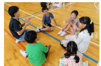
「バケツの水をこぼしてしまった人に、何て言えばいいんだろうか？」