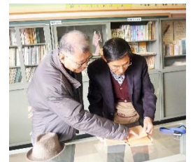
当時の文集「おひさま」を手にされて

は、「私たちの校歌を聴いて五小を見守ってくださいね」と私たちの歌声が入った校歌DVDのプレゼントがありました。会の後、本校の歴史資料館を見学していただきました。当時の「おひさま文集（第2号）」に掲載されていた作文に目がとまると当時を回想され、涙を浮かべられた方もおられました。その姿を見て、文集「おひさま」は、小学校時代を想起させる最高の宝物であることを改めて感じました。