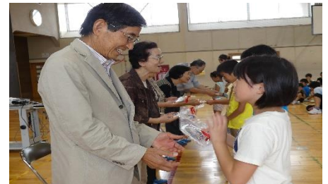
先輩方へ校歌 DVD をプレゼントしました

階段やグラウンドから見える千歳山の風景は全く変わっていませんと懐かしんでおられました。子ども達から