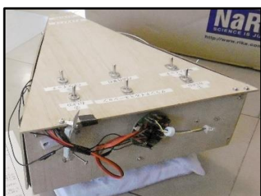
自動清掃ロボット

昨年年度の作品展を見に行った時、金賞になった清掃ロボットは手動仕掛けでした。僕は研究すれば自動仕掛けに出来るのではないかと、思い挑戦しました。