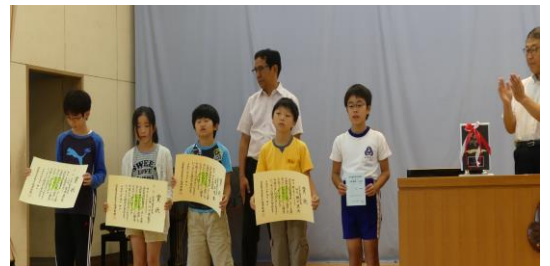
表彰式で賞状を掲げる子ども達

昨年年度の作品展を見に行った時、金賞になった清掃ロボットは手動仕掛けでした。僕は研究すれば自動仕掛けに出来るのではないかと、思い挑戦しました。