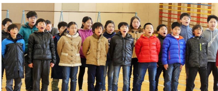
5年生 呼びかけ「6年生へのメッセージ」