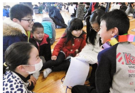
後輩からのメッセージを読む6年生