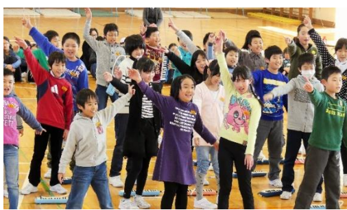
4年生 合奏「クラッピングファンタジー」