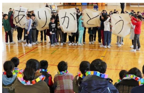
3年生 書道パフォーマンス／大縄跳び