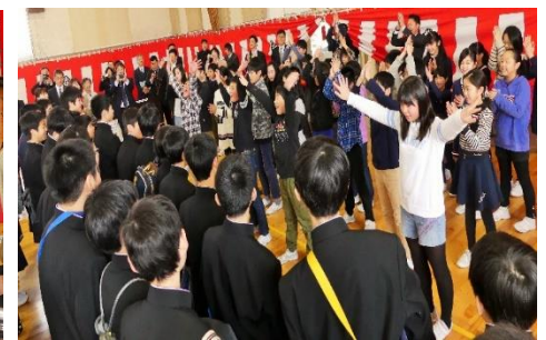
5年生による激励のエール