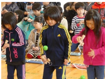
2年生 剣玉披露／合奏「こぐまの二月」