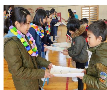
首飾りとメッセージのプレゼント