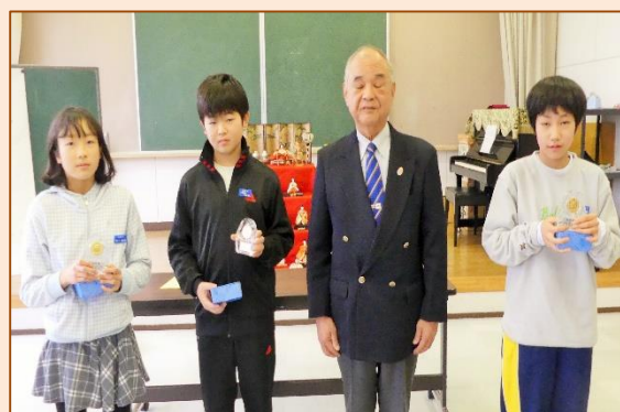
6年間の「皆勤賞」を受賞した子ども達