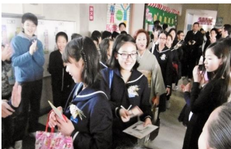
後輩が卒業生に感謝の手紙を渡す門出

この6年間、体とともに 心も大きく成長 しました。福祉施設への訪問やエコキャップ回収等、「 人の役に立つこと 」に喜びを感じ、 率先的に活動を広げて きました。特に、これまでゲームや遊びが中心であった「なかよし縦割り班」の活動に、 清掃奉仕の活動を取り入れられないかとの提案 により、なかよし縦割り班で掃除をするようになりました。6年生は、「雑巾は半分に折って、手が壁につくまで拭こうね。」等と下級生にわかりやすく教えていました。あおぞら学年が考えてくれたこの縦割り班での掃除は、価値のある活動として、ずっと続いていくことになるでしょう。