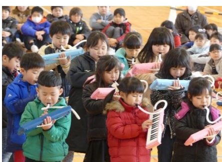
1年生 合唱奏「こいぬのマーチ」