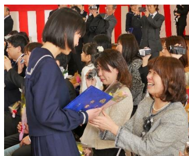
感謝の花束をお母さんへ