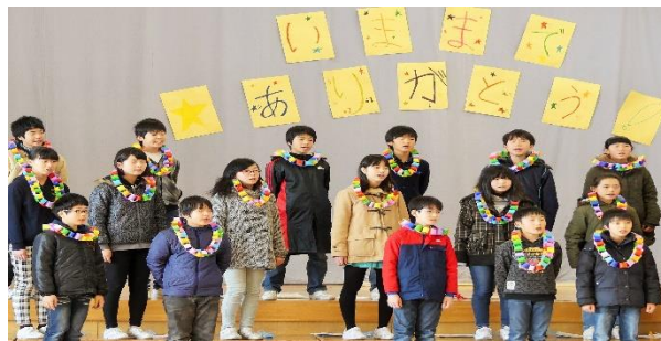
6年生 合唱「ありがとう」